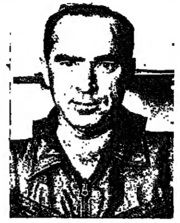
والبحت عنها... ثم التي كل من الجنرال ايتان وممثل...